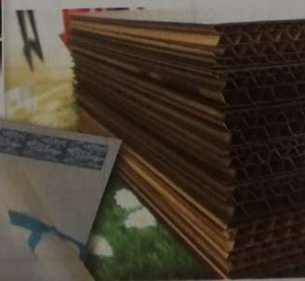
Cartone, carta da parati e tissue.