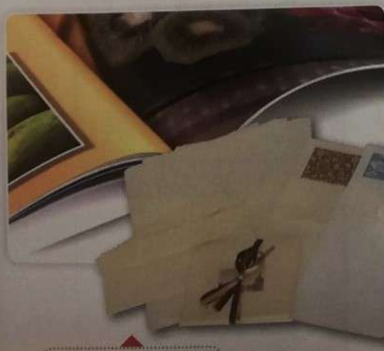
Carta patinata e carta da lettere.

- Le carte per usi domestici, come la carta igienica, i fazzoletti e i tovaglioli di carta fanno parte della nostra vita quotidiana così come le carte utilizzate in edilizia di cui il cartongesso (impiegato nella costruzione di pareti interne divisorie e controsoffitti) e la carta da parati (utilizzata per tappezzare le pareti) si possono facilmente trovare nelle abitazioni.