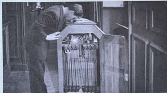
Il Kinetoscopio di Edison.