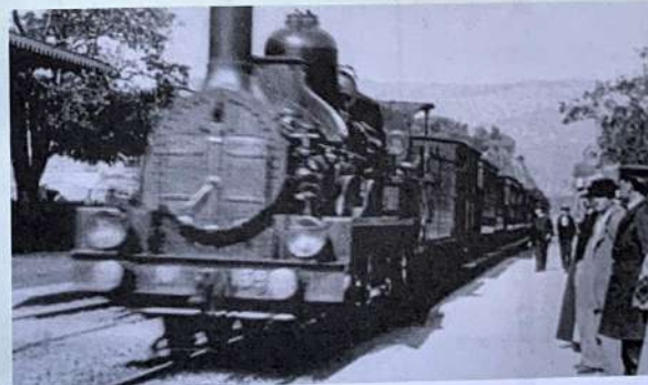
Un fotogramma del cortometraggio dei fratelli Lumière.