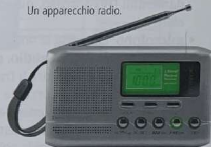
Un apparecchio radio.

Se la stazione radio trasmette il segnale tramite Internet, si parla di web radio . L'audio viene inviato come flusso di dati ( in streaming ), che il computer o gli altri dispositivi digitali decodificano.