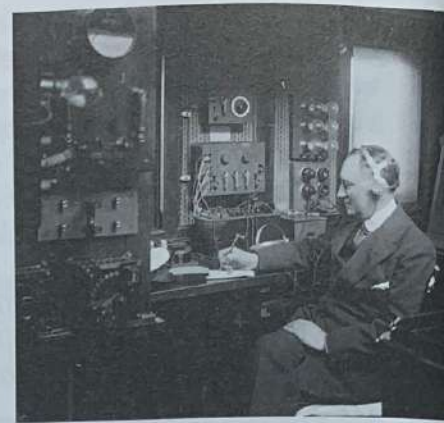
Guglielmo Marconi al telegrafo.

Gli elementi fondamentali perché possa avvenire una trasmissione radio sono due: la stazione trasmittente , che trasforma le onde sonore emesse da qualsiasi fonte e le trasmette attraverso le onde radio, e la stazione ricevente , che riceve e decodifica il segnale radio riconvertendolo in onde sonore.